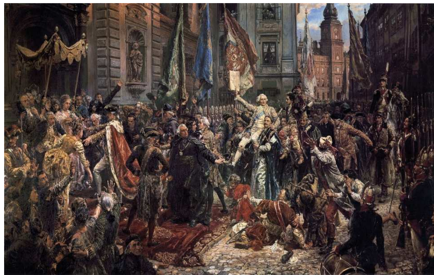
Obraz Jana Matejki „Konstytucja 3 Maja”

Po odzyskaniu niepodległości w 1918 roku, rocznica uchwalenia Konstytucji 3 Maja została uznana za święto narodowe już przez Sejm Ustawodawczy 29 kwietnia 1919 roku. Po II wojnie światowej obchodzono je do 1946 roku, kiedy to w wielu miastach doszło do demonstracji studenckich. Od tego czasu władze komunistyczne zaprzęstały i zabroniły publicznego świętowania, a próby manifestowania były często tłumione przez milicję. Święto Narodowe 3 Maja przywrócono ustawą z 6 kwietnia 1990 roku. Pierwsze uroczyste obchody święta 3 Maja w Warszawie odbyły się na Placu Zamkowym w 1990 roku.